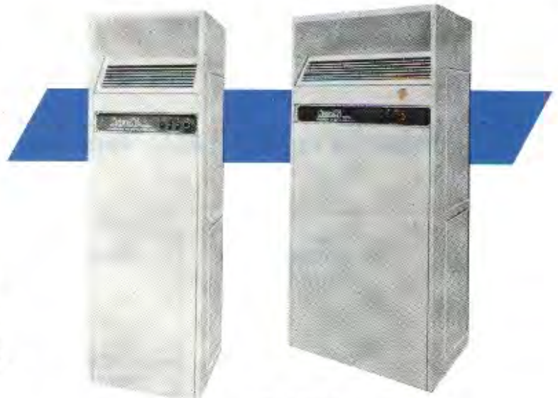
Modelo COP 15