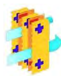
Lâminas com tecnologia Hayashi